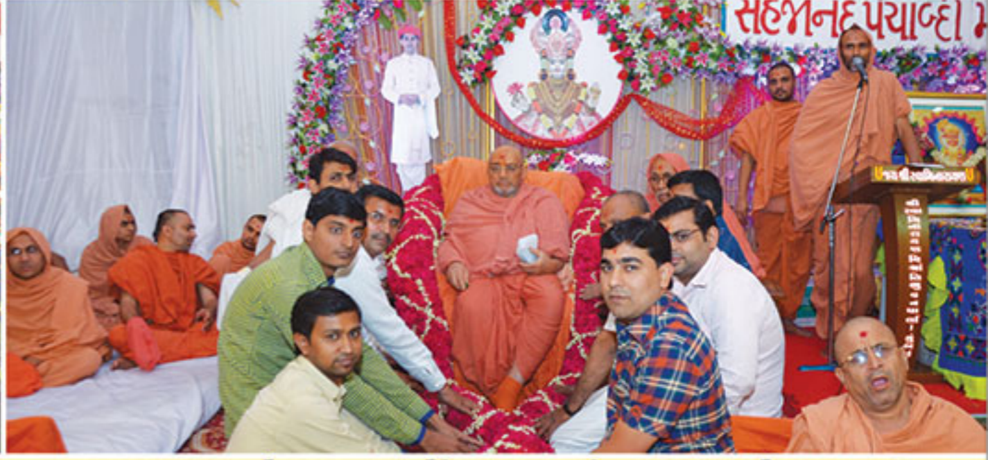
૩૫ શ્રી સ્વામિનારાયણ સત્સંગ ભવન થાણાનો સહજાનંદ પંચાબ્દી મહોત્સવ હર્ષોદ્ઘાસ પૂર્વક ઉજવાયો-મુંબઈ