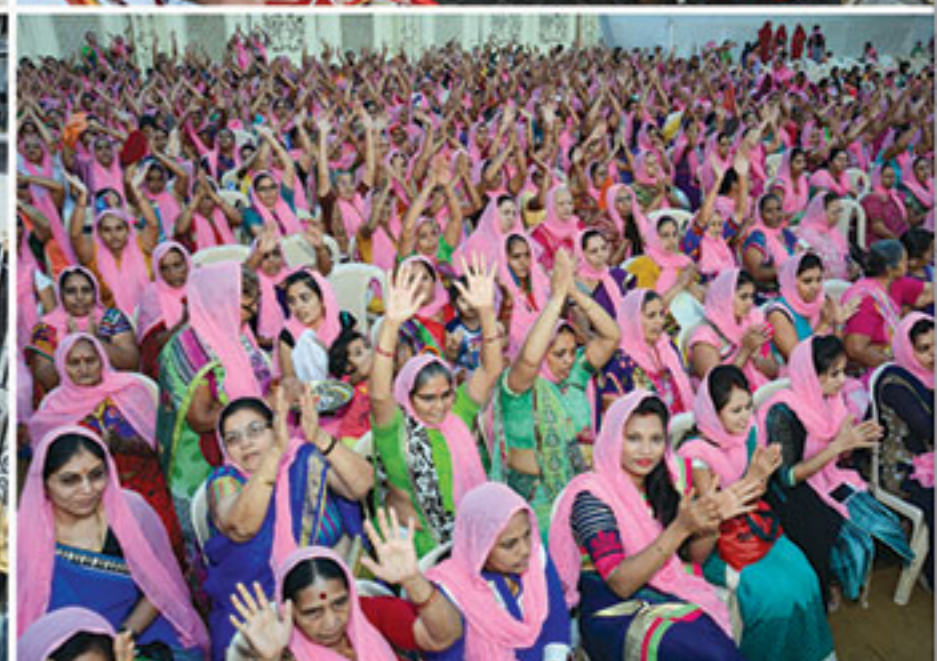
શ્રી સ્વામિનારાયણ વિશ્રાંતિ ભવન વિલે પાર્લેના ઠાકોરજીનો ૧૮મો વાર્ષિક પાટોત્સવ ઉપક્રમે શ્રી સ્વામિનારાયણ મહોત્સવની ઉત્સાહ પૂર્વક ઉજવાણી થઈ-મુંબઈ