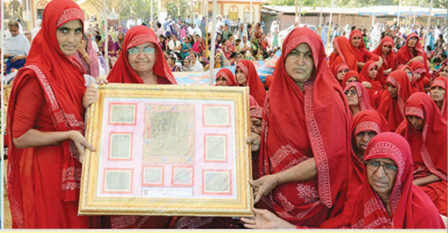
શ્રીહરિ તપોવન ગુરુકુળ ગંગાજી રામપર-વેકરામાં શાકોત્સવ સાથે આનંદોત્સવ ઉવજાયો. મલ્ટિમિડીયા હોલનું ઉદ્ઘાટન થયું.