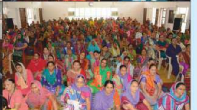
શ્રી સ્વામિનારાયણ મંદિર કાલુપુર દ્વારા પ.પૂ.આચાર્ય મહારાજશ્રીની આજ્ઞાથી આયોજીત ઋષિકેશમાં શ્રીમદ્ ભાગવત સમાહ પારાયણ