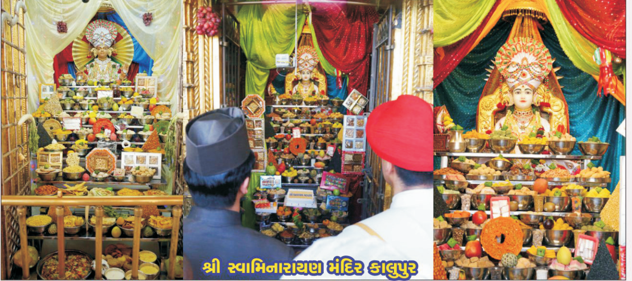
શ્રી સ્વામિનારાયણ મંદિર કાલુપુર