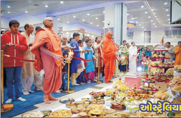
ओस्ट्रेलिया - सिडनी