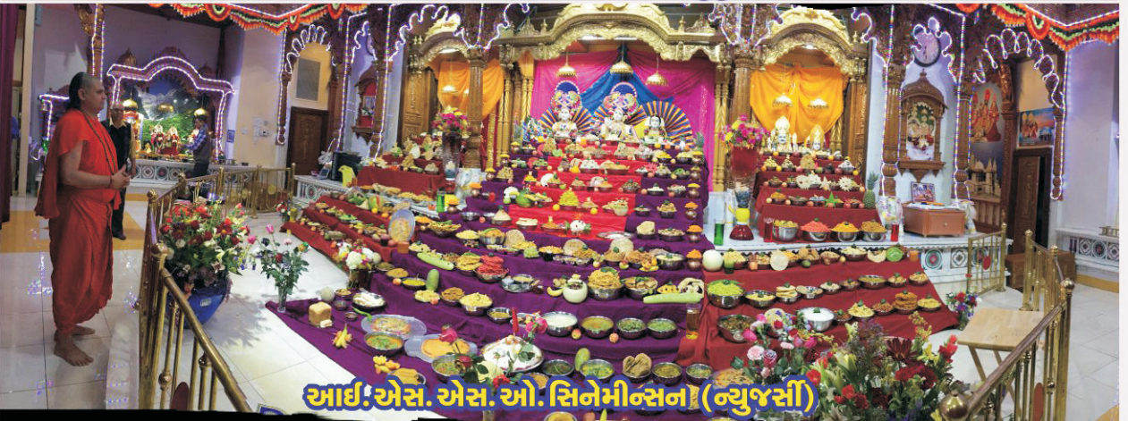
આઈ! એસ. એસ. ઓ. સિનેમીન્સન! (ન્યુજર્સી)