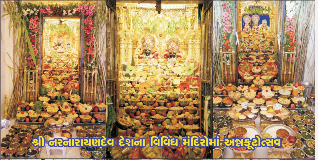
શ્રી નરનારાયણદેવ દેશના વિવિધ મંદિરોમાં અન્નકૂટોત્સવ