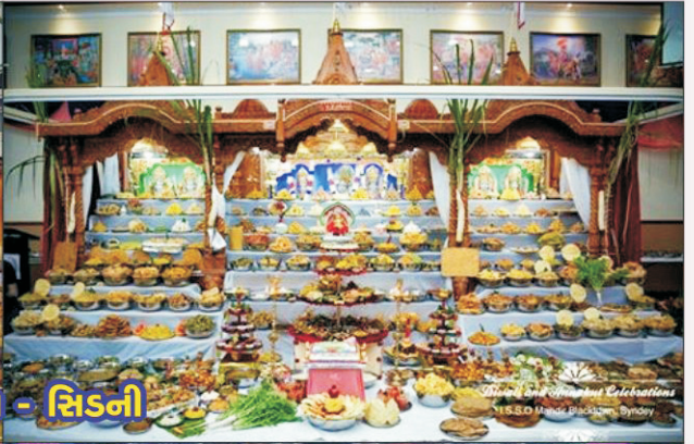
International Religious Celebrations N.S.S.O. (Newspaper, Publishing, Syndicate)