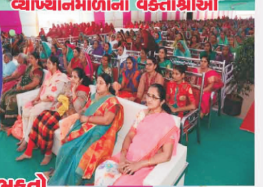
કથાપાન કરાવતા વક્તાશ્રી તથા કથાપાન કરતા સંતો હરિભક્તો