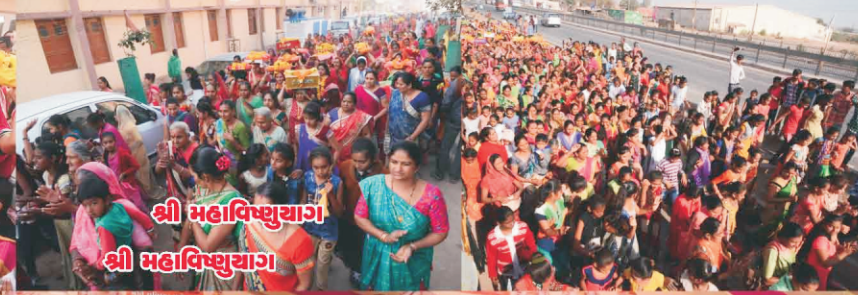
શ્રી મહાવિષ્ણુયાગ શ્રી મહાવિષ્ણુયાગ