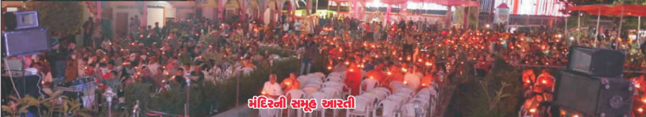
મંદિરની સમૂહ આરતી