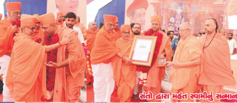
સંતો હારા મહેતા સ્વામીનું સન્માન