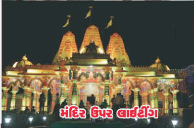
મંદિર ઉપર લાઈટીંગ