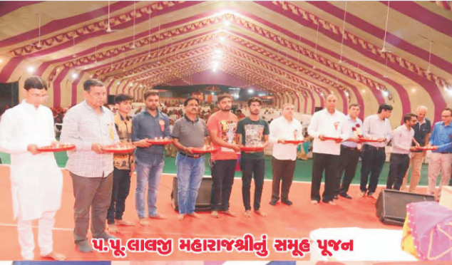
પ.પૂ.લાલજી મહારાજશ્રીનું સમૂહ પ્રવચન